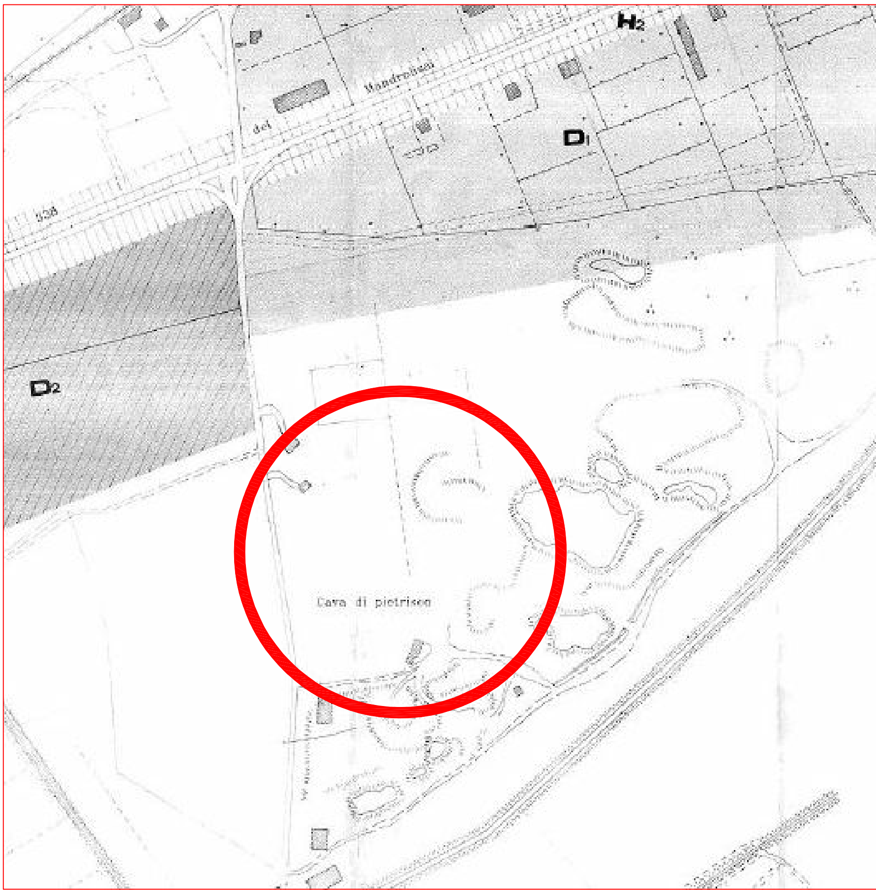
STRALCIO DEL PUC SC. 1:4000